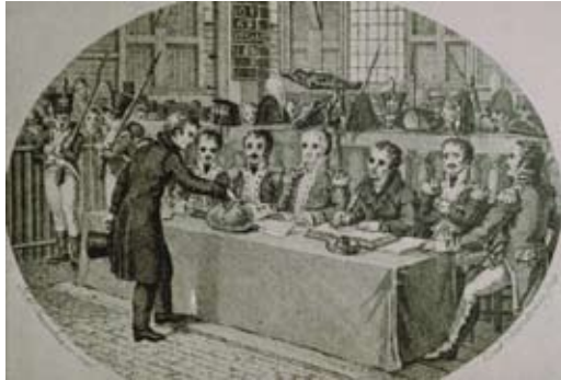
Loteling trekt nummer

Napoleon schijnt geen hoge dunk van de Nederlandse soldaat gehad te hebben, maar voor de vissers en zeelui had hij respect, omdat zij op het water thuis waren. Zij moesten zich melden bij de maritieme conscriptie.