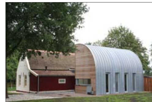
Eigentijds en opmerkelijk bijgebouw naast een oud boerenhuisje in Bargebek aan de Jachtlustweg.