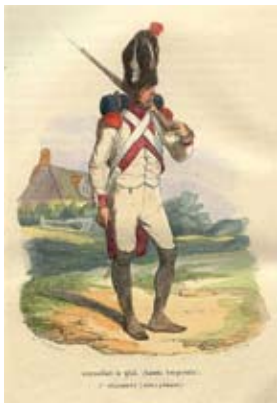
Grenadier van Napoleon