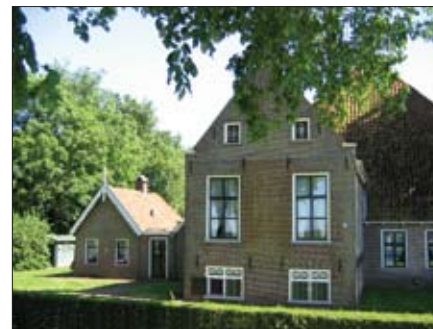
Boerderij aan de Wijckelerweg in Sloten met een zomerhuisje in traditionele stijl..