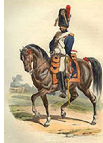
Grenadier te paard

Een aantal Gaasterlanders meldden zich vrijwillig, maar zagen het later niet meer zitten en namen de benen. Onder hen was Harmen Berends Veltman, scharenslipjer te Balk, lengte 166,5 cm. Hij was remplaçant voor Pieter Meine Meinema uit Harich en moest zich in 1812 in Groningen melden. Eenmaal daar aangekomen had hij het al snel bekeken en deserteerde twee maanden later ook.