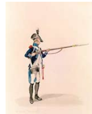
Jager in het leger van Napoleon