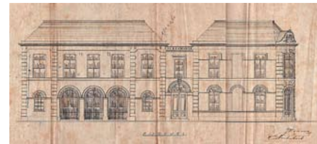
De gevel aan de Lytse Side.