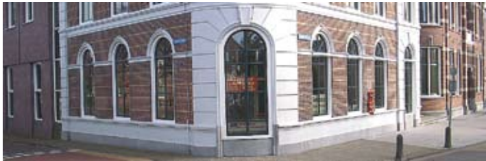
Hoek Dubbelstraat en Lytse Side

De bibliotheek in Balk gaat verhuizen. De in 1965 gebouwde ruimte aan de Bogermanstraat is te klein en voldoet niet meer aan de eisen van deze tijd. De nieuwe locatie is op de hoek van de Dubbelstraat en de Lytse Side. Hiervoor wordt een deel van het gemeentehuis verbouwd.