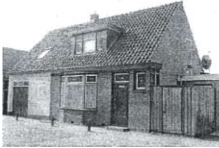
De âlde Formoanje in 2006 : garaazje plus wenhûs.