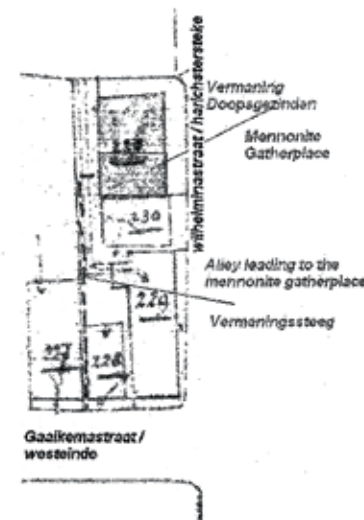
In lyts stikje fan de âldste kadasterkaart van 1832, wêr't de Formoanjestege op oan jûn is.

Wêr stie de âlde Formoanje? Hoewol de âlde Formoanje as sadanich net mear bestiet, is it plak dêr't er stie, noch goed te situearjen. De tsjerke stie oan de s.n. Harichster steke, de hjoeddeiske Wilhelminastraat. De yngong lykwols, wie fia de Formoanjestege te berikken. In stege dy't begûn oan wat no de Gaaikemastraat hyt, de wei oan de Luts. Op de âldste kadasterkaart is dizze stege noch goed werom te finen.