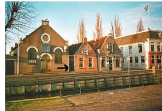
Âld Gereformeerde tsjerke mei yngong Formoanjestege

Soberens, iver, sunigens, neistenleafde en tucht: dat wie it wol sa wat wêr't de 'Oude Friezen' har oan te hâlden hiene. Ien en oar brocht wol mei dat de leden it yn it algemien goed hiene. Ekonomyske motiven sille dan nei alle gedachten ek net mei laat hawwe ta de evakuaasje yn 1853 en 1854.