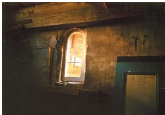
Rútsje fan de âlde Formoanje