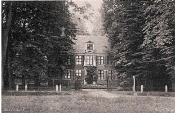
Huize Rijs, kort voor de verkoop en sloop in 1937