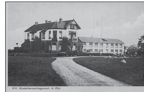
Villa 'Mooi Gaasterland' 1940

De Winterhulp collecten worden naar Duits voorbeeld gehouden maar zullen in Gaasterland geen succes hebben. Doelstelling is dat sociaal zwakkeren en langdurig zieken worden geholpen doch het geld blijkt aan andere Duitse doelen op te gaan, terwijl de Joden met deze opbrengsten niet worden gesteund.