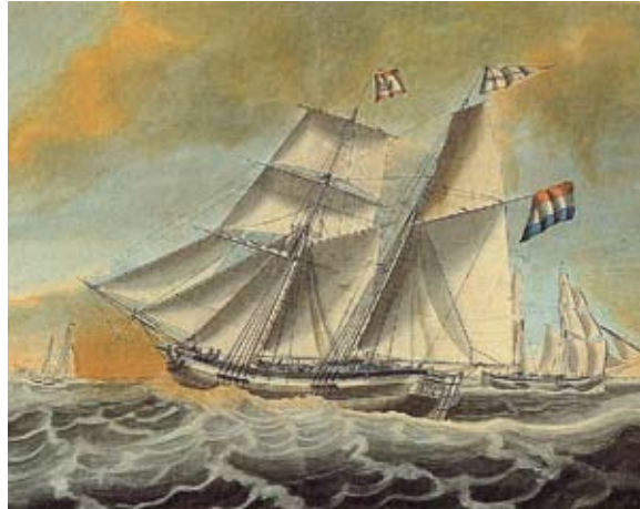
Een Kofschip op volle zee

In 1839 werden er in Woudsend en Lemmer vier kofschepen gebouwd voor de ‘n.v. Friesche Kofscheepsrederij’. Deze rederij was gevestigd in Woudsend. Friese schepen gebouwd op Friese werven, maar de schepen zijn na de tewaterlating nooit in Friesland terug geweest. Amsterdam was de thuishaven. Daar werd de bemanning aangenomen, daar werd de leeftocht voor een reis ingeslagen en werden de reparaties uitgevoerd. Geen wonder dus dat veel Amsterdamse ondernemingen aandeelhouder waren van deze rederij.