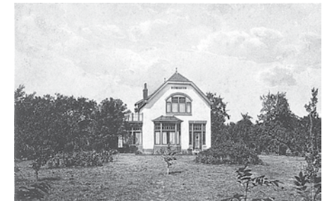
Villa ‘De Stins’ gebouwd op de plaats waar ooit de ‘Minnemastate’ stond.