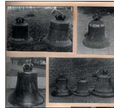
Door de Duitsers ingezamelde kerkklokken in Gaasterland, gevorderd eind 1942.