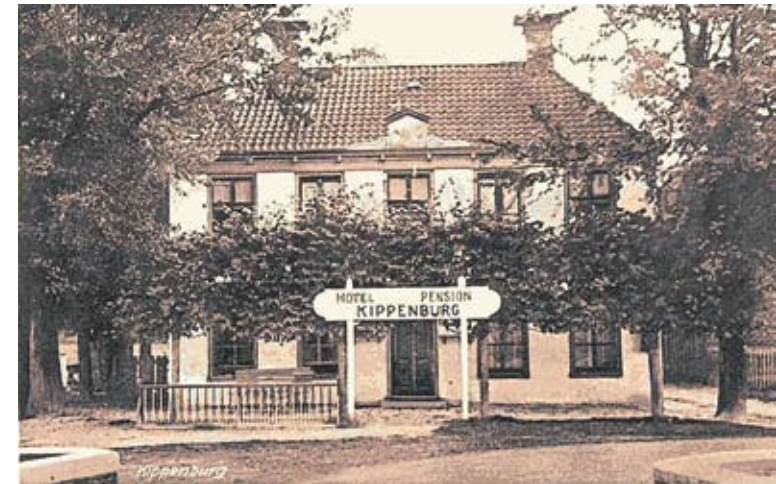
Kippenburg in 1933

De naam ‘Kippenburg’ is verbonden aan een landhuis met bijgebouwen in de nabijheid van het riviertje de Luts dat van oudsher doorliep naar het dorp Balk.