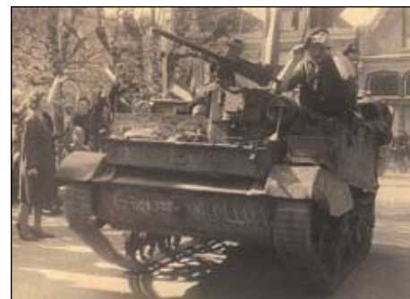
Bevrijding van Balk: de eerste Canadese tank verschijnt bij het oude raadhuis op 17 april 1945.

Dan nadert de glorieuze Gaasterlandse dag van de bevrijding op 17 april 1945 wanneer om 15.40 uur de eerste Canadese tank verschijnt bij het oude raadhuis in Balk. De tanks behoren tot de 17th Duke of Yorks Royal Canadian Hussars.