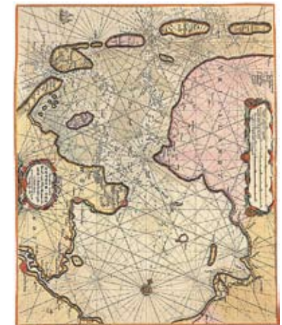
Zeekaart van het Zuiderzeegebied anno 1676.

De afbeeldingen zijn overgenomen uit ‘Roeien met de riemen’ 75 jaar Vereniging Nederlands Historisch Scheepvaartmuseum. Jaarboek 1991.