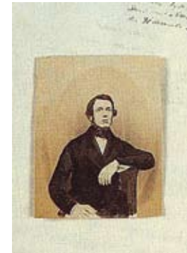
Portret van een stuurman van de grote vaart ca. 1850

Uiteraard werd het onderwaterschip goed schoon gemaakt. Door aangroei werden de schepen traag en in het uiterste geval kon men er nauwelijks nog mee manoeuvreren. Niet zelden klaagden de kapiteins over de enorme aangroei waardoor ze nauwelijks snelheid konden maken. In 1846 meldt een kapitein aan de rederij in Woudsend: ‘De Friesland is zo groen tussen wind en water, dat een paar schapen hadden wel veertien dagen kouwen aan om het op te krijgen’. In een ander geval meldt de kapitein dat het zeegras wel 6 à 7 duim lang is en de dorren als vuisten zo groot. Met alle zeilen bij vorderde de reis niet sneller dan 2 à 3 zeemijlen.